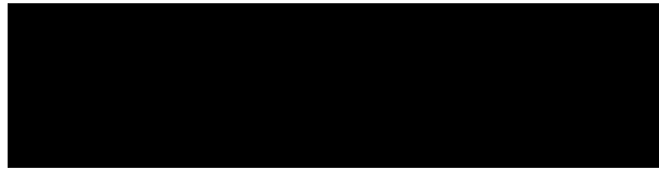
Figura 2 – Exemplo de fonte com sua figura.